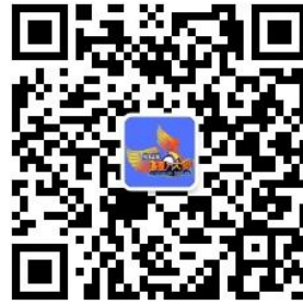
全国 3D 大赛微信公众号

全国三维数字化创新设计大赛组委会 国家制造业信息化培训中心 全国 3D 技术推广服务与教育培训联盟(3D 动力) 光华设计发展基金会 2023 年 3 月