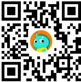
新灵兽实验室平台

官方网站：年度竞赛： https://3dds.3ddl.net/ 精英联赛： https://ds.3ddl.net