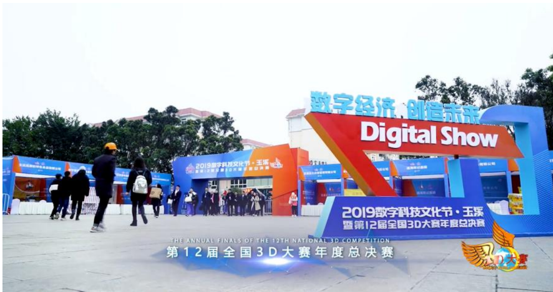
▷ 宣传片: 大赛专家说