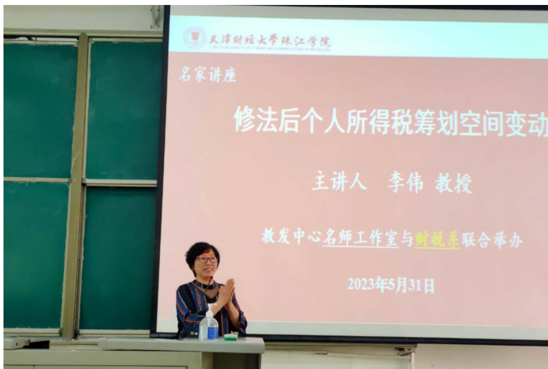
“修法后个人所得税筹划空间变动”主题会场