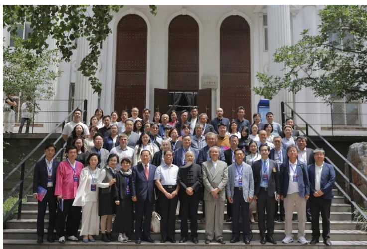
各国与会代表教师在河北美术学院图书馆门前合影

在此次学术论坛中，共有 20 名海内外高校艺术学科领域的专家学者围绕“融合·共生”的论坛主题进行发言，学术主持由清华大学美术学院陈池瑜教授担任。此次论坛除主论坛外同时设置了泰国玛哈沙拉堪大学分论坛。