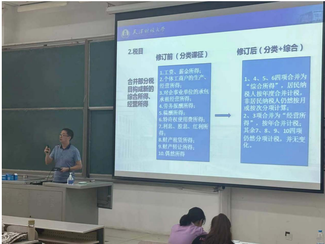
李伟教授分析个人所得税法修订情况