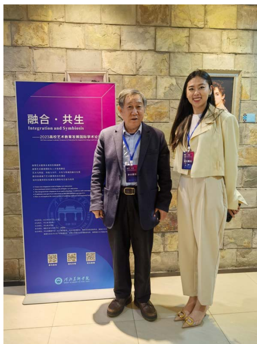
芮正佳老师与学术主持人清华大学美术学院陈池瑜教授合影留念