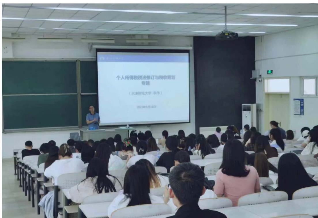
财税系全体教师及 200 余名学生参会